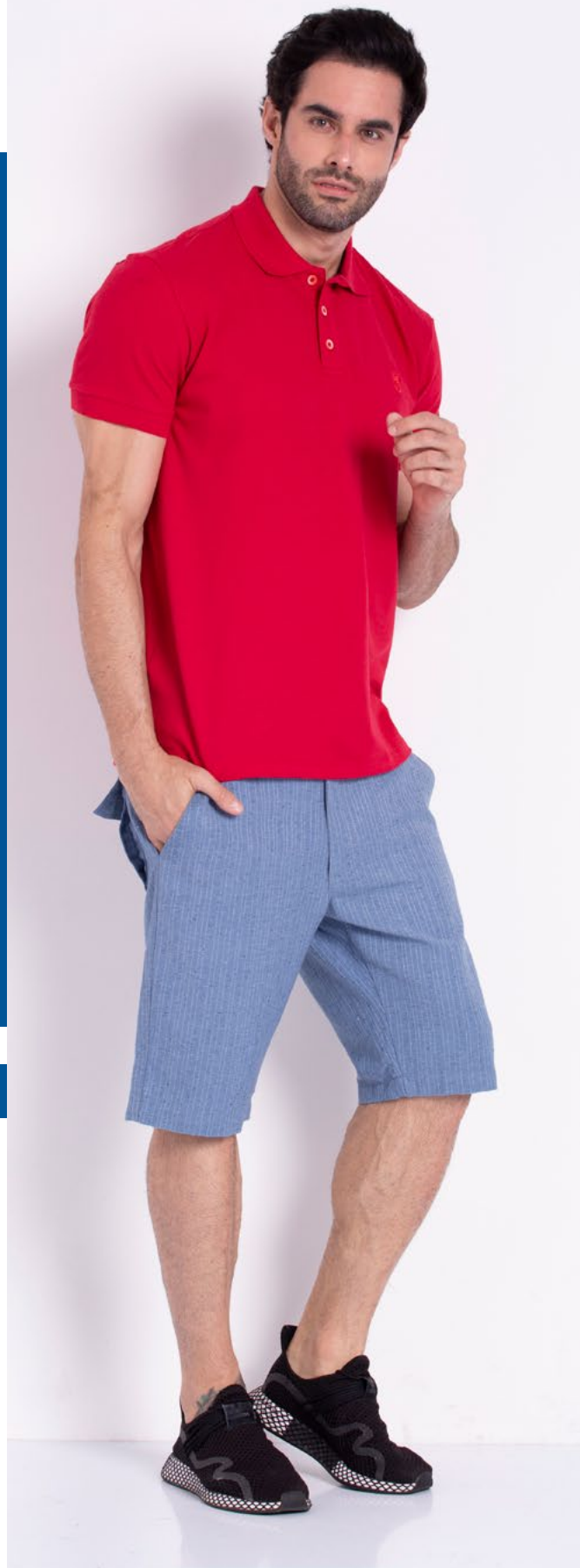
Camiseta Polo Tradicional Piquet Confort 95% Algodão 5% Elastano Tam.: P ao S5 Ref.: 3361