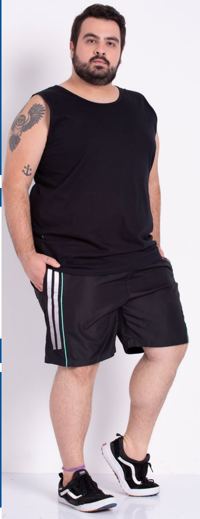
Regata Tradicional Malha 100% Algodão Tam.: P ao S8 Ref.: 4422