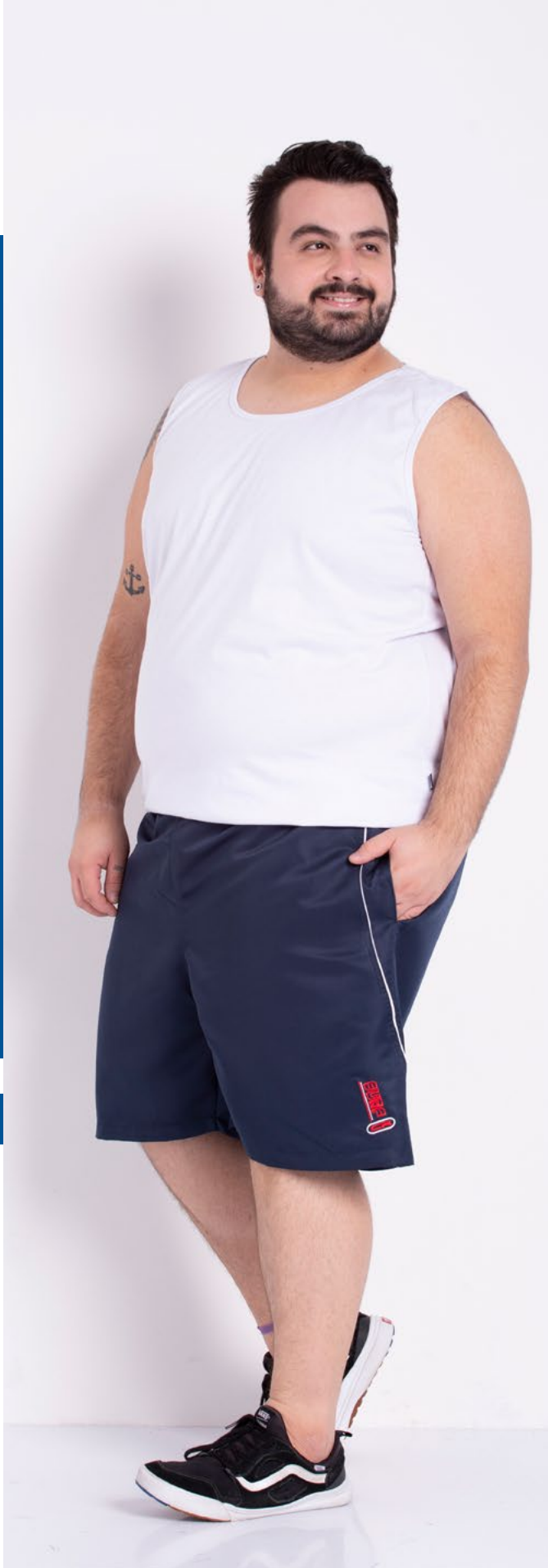
Regata Tradicional Malha 100% Algodão Tam.: P ao S8 Ref.: 4422