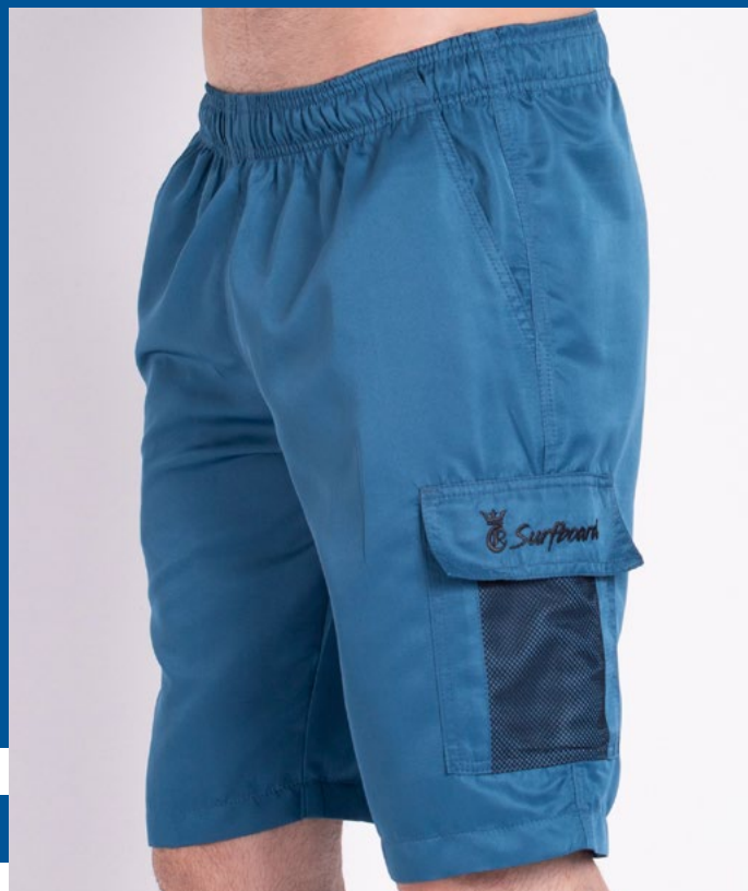
Bermuda de Elástico Micro Sarja 100% Poliéster Tam.: 6 ao S5 Ref.: 427