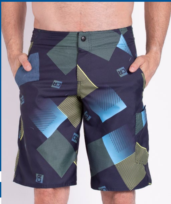
Bermuda de Cós Surf Sublimada Micro Sarja Neo Subli 100% Poliéster Tam.: 36 ao 54 Ref.: 437