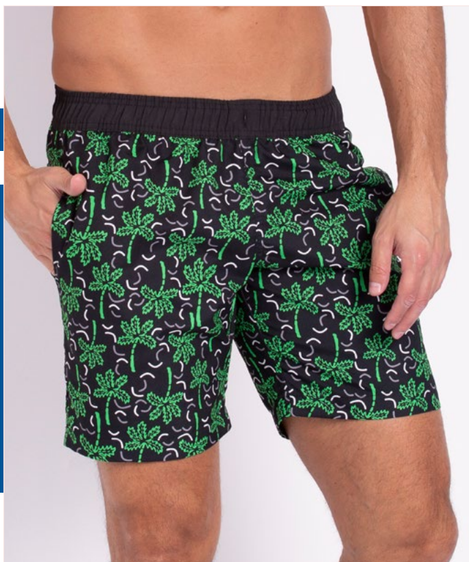
Shorts de Elástico Micro Fibra Estampado 100% Poliéster Tam.: 6 ao 55 Ref.: 404