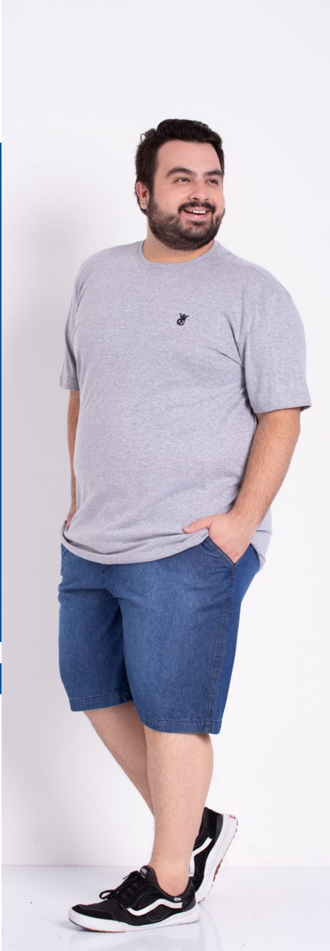
Camiseta Tradicional Malha Sensation 62% Algodão 38% Poliester Tam.: 2 ao 58 Ref.: 1225