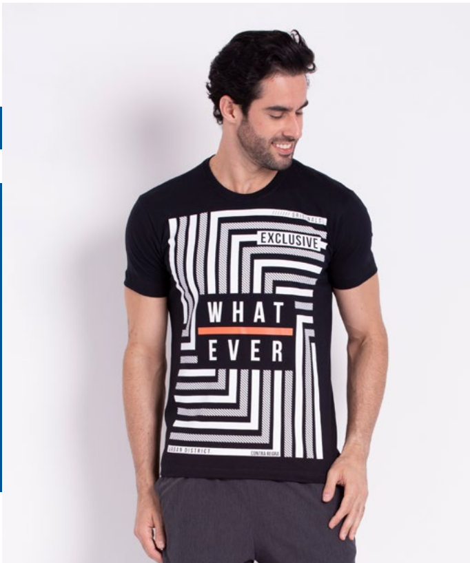
Camiseta Street Malha 100% Algodão Tam.: P ao GG Ref.: 1541