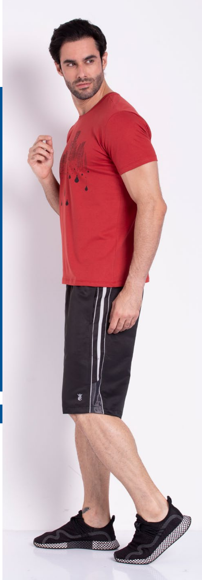
Camiseta Street Malha 100% Algodão Tam.: P ao GG Ref.: 1539