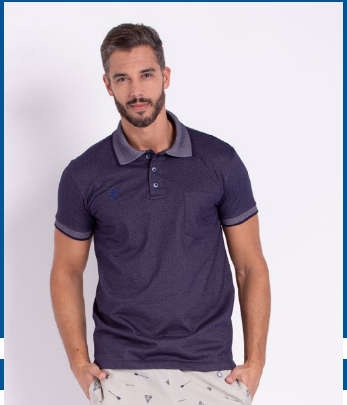
Camiseta Polo Tradicional Malha Jacquard 95% Algodão 5% Elastano Tam.: P ao S5 Ref.: 3360