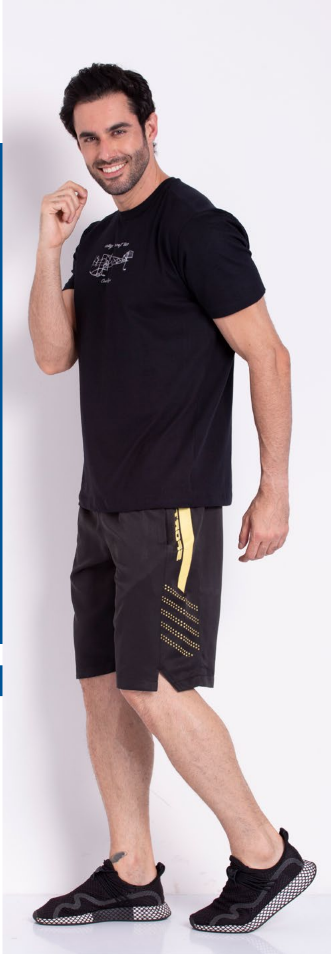
Camiseta Tradicional Malha 100% Algodão Tam.: P ao S8 Ref.: 1533