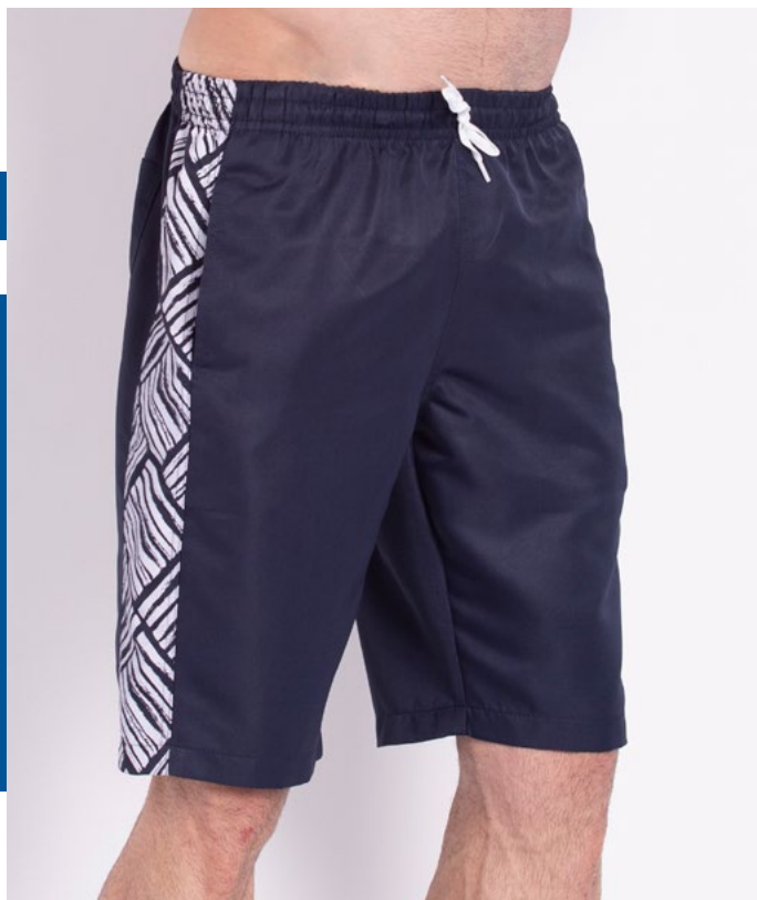
Bermuda de Elástico Micro Sarja 100% Poliéster Tam.: P ao S8 Ref.: 403