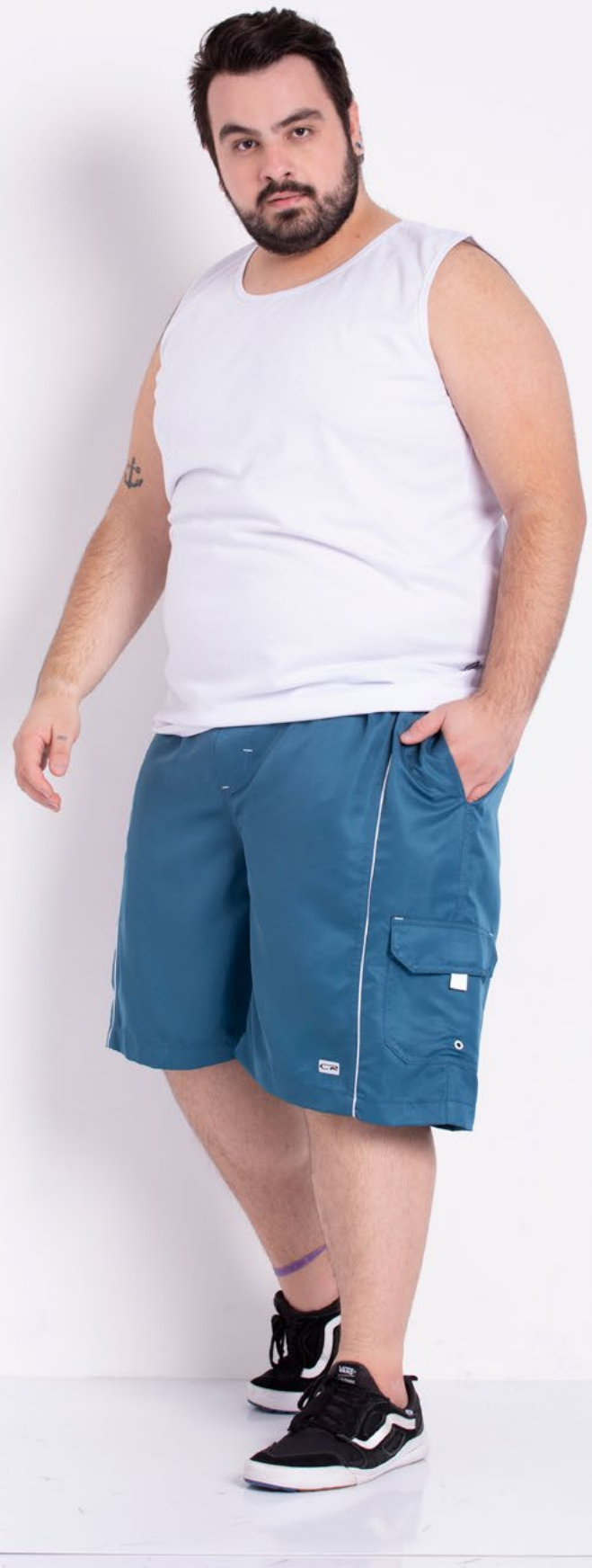
Regata Tradicional Malha 100% Algodão Tam.: P ao S8 Ref.: 4422