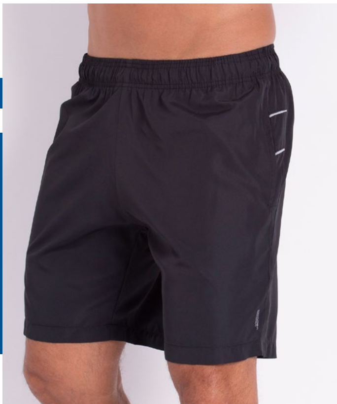
Bermuda Mais Curta de Elástico Dry Fit 100% Poliéster Tam.: P ao S8 Ref.: 414