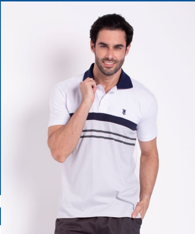
Camiseta polo Tradicional Malha 100% Algodão Tam.: P ao S5 Ref.: 3367