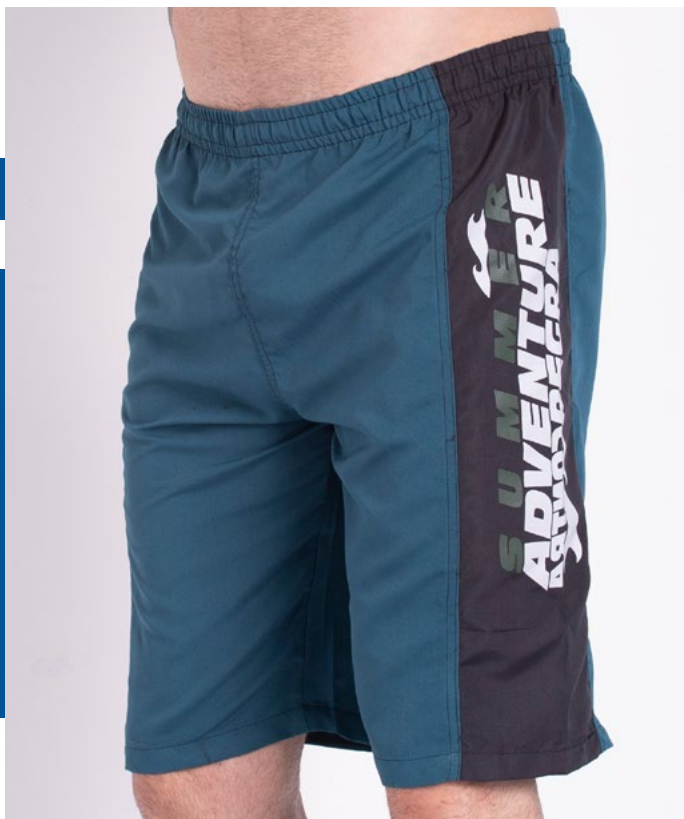
Bermuda de Elástico Micro Fibr 100% Poliéster Tam.: 2 ao GG Ref.: 14