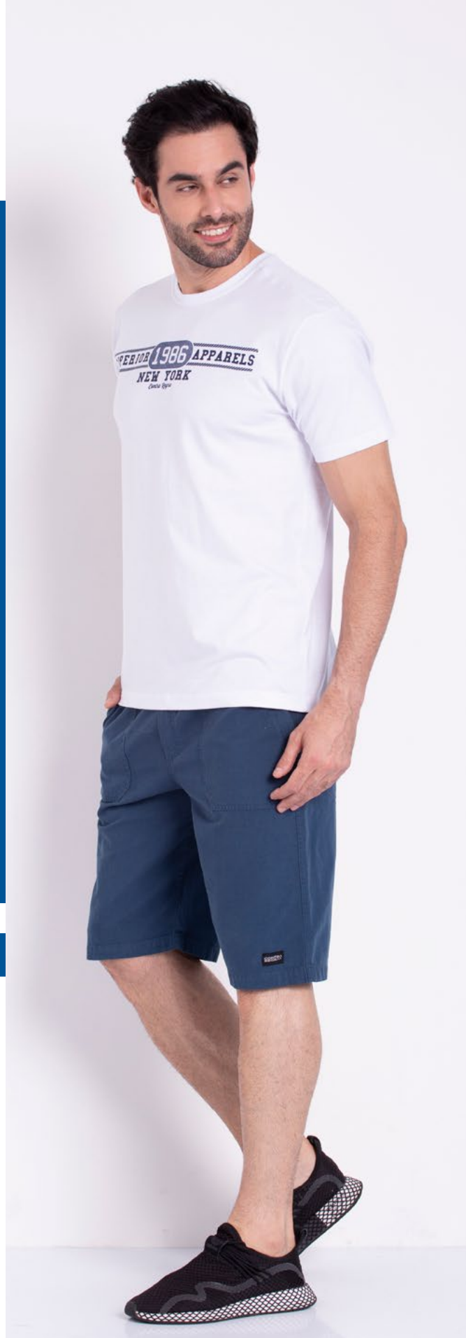
Camiseta Tradicional Malha 100% Algodão Tam.: P ao S8 Ref.:1534