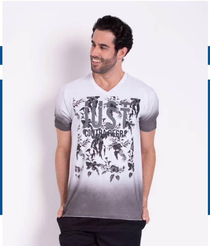
Camiseta Tradicional Malha 100% algodão Tam.: P ao S5 Ref.: 1543