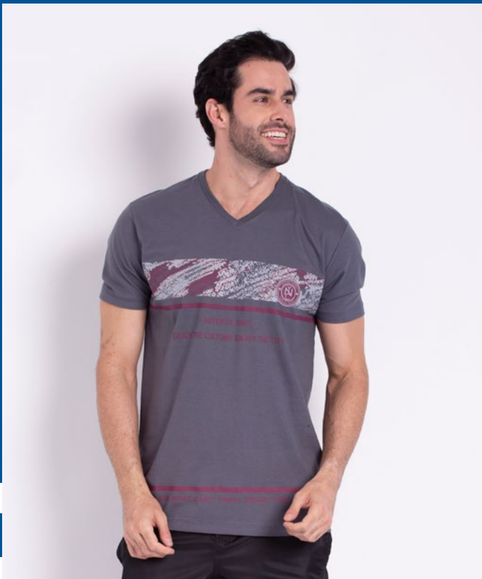
Camiseta gola V Tradicional Malha 100% Algodão Tam.: P ao S8 Ref.: 1279