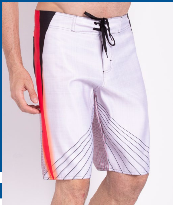
Bermuda de Cós Surf Micro Sarja Sublimada 100% Poliéster Tam.: 36 ao 48 Ref.: 439