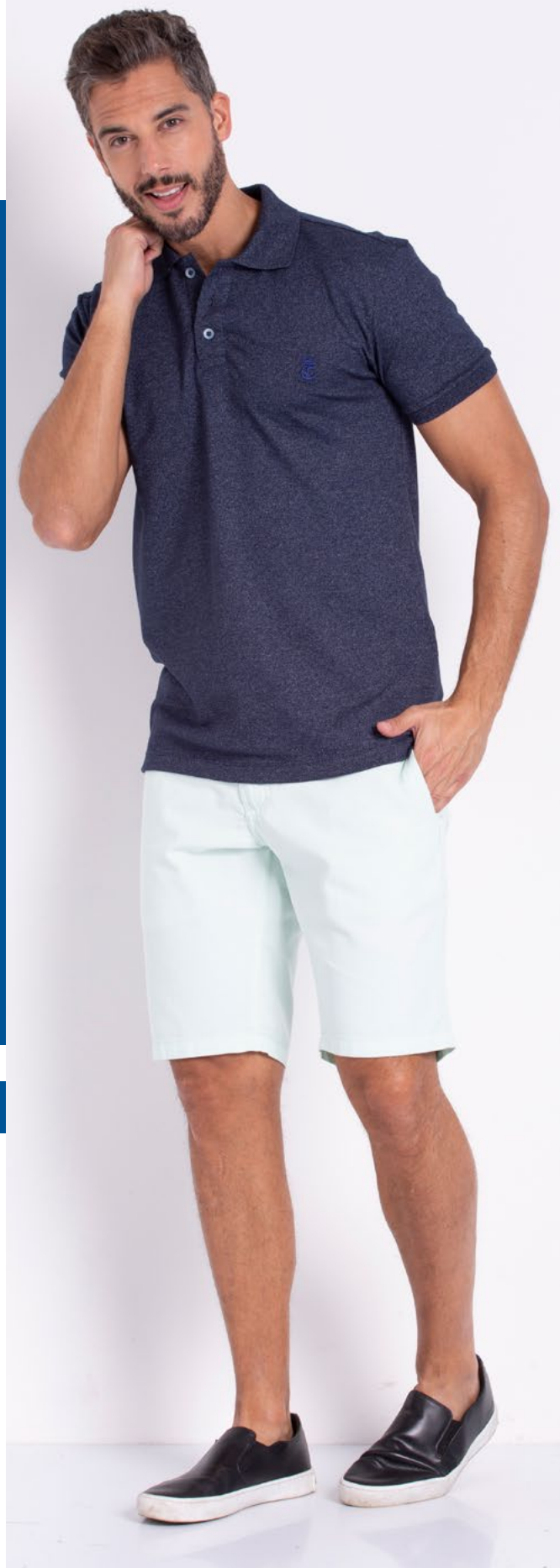
Camiseta polo Tradicional Jacquard 95% Algodão 5% Elastano Tam.: P ao S5 Ref.: 3362