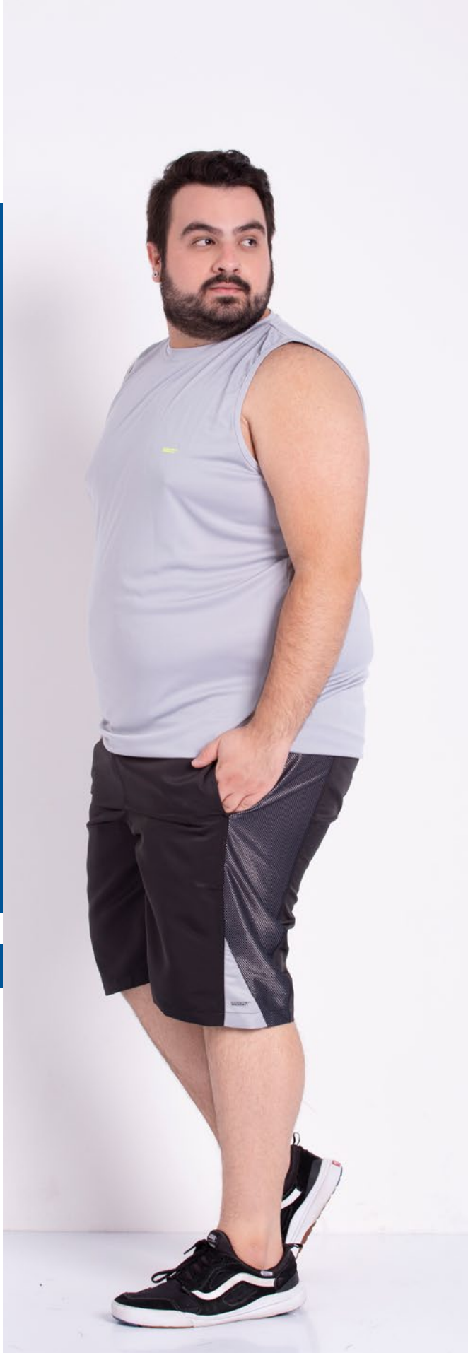
Regata Tradicional Fitness Helanca 100% Poliéster Tam.: P ao S5 Ref.: 4450