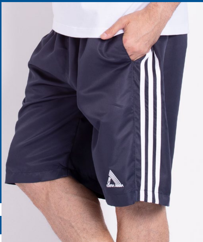
Bermuda Micro Sarja 100% Poliéster Tam.: 4 ao S8 Ref.: 496