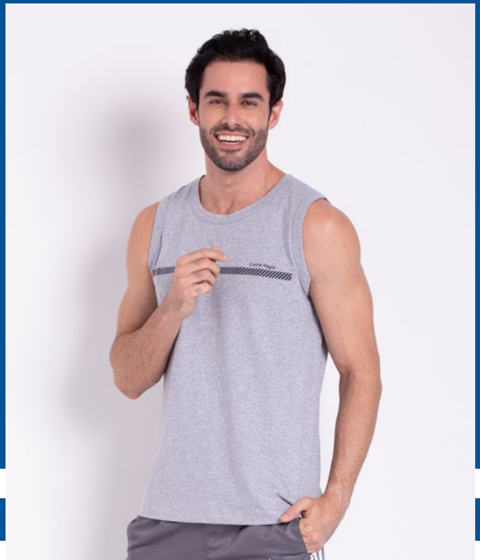
Regata Tradicional Malha 100% Algodão Tam.: P ao S8 Ref.: 4453