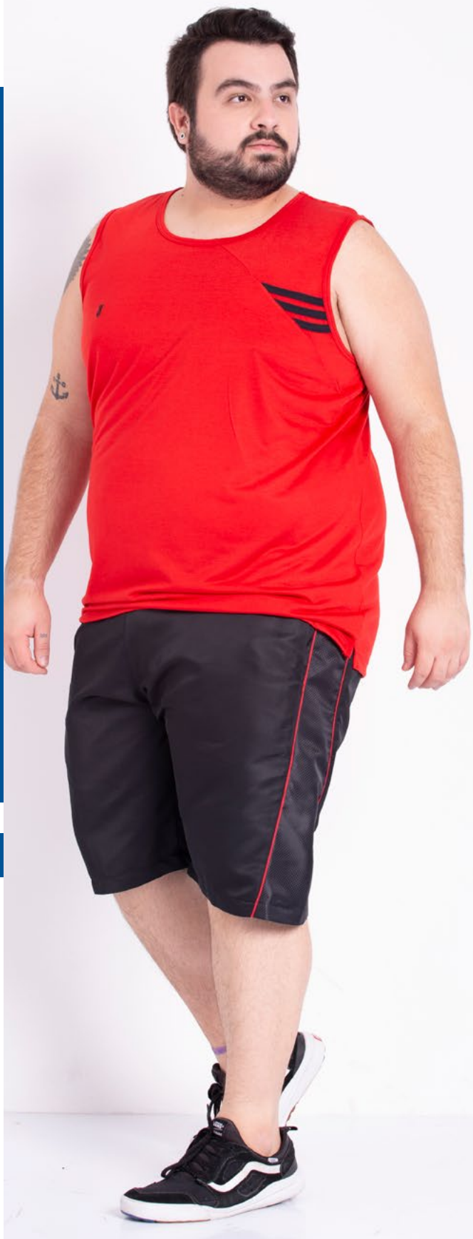
Regata Tradicional Malha PV 65% Poliéster 35% Viscose Tam.: P ao S8 Ref.: 4448