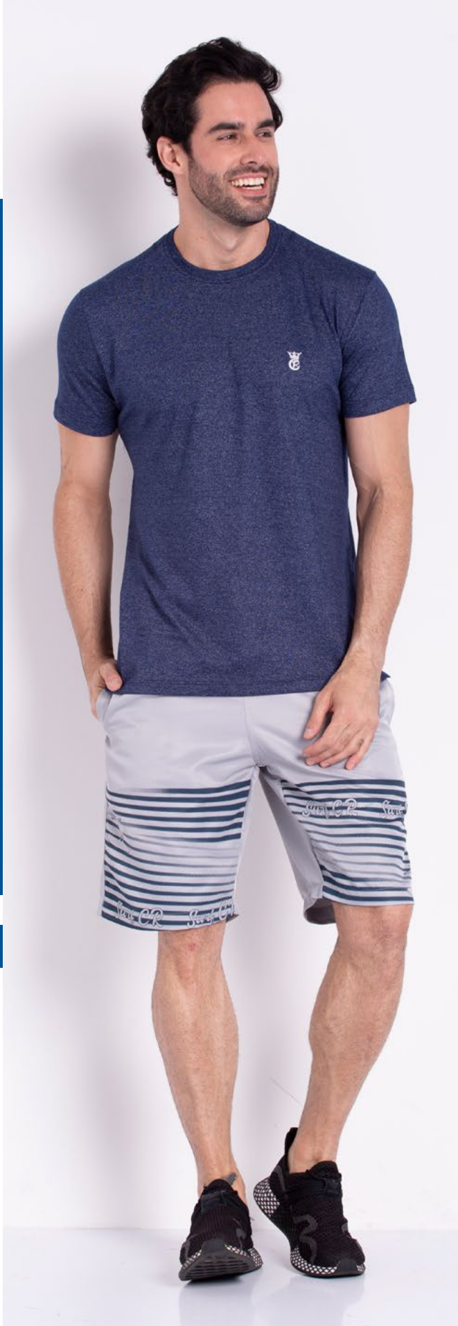
Camiseta Tradicional Malha Sensation 68% Algodão 32% Poliéster Tam.: 2 ao S8 Ref.: 1225