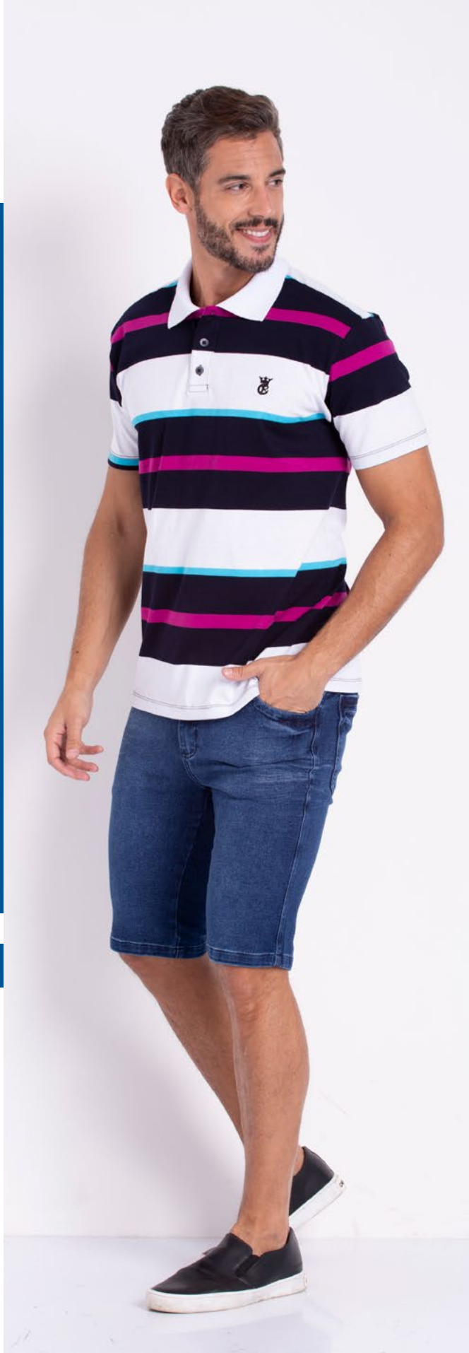
Bermuda de Cós Jeans Moletom 82% Algodão 16% Poliéster 2% Elastano Tam.: 36 ao 52 Ref.: 220