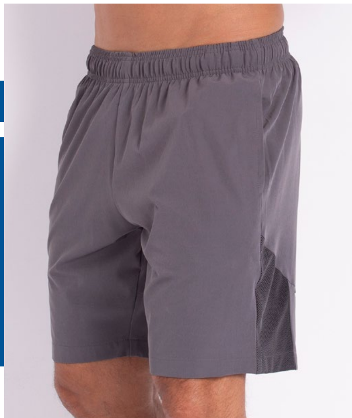
Bermuda Mais Curta de Elástico Hidronautic Soft - 91% Poliéster 9% Elastano Tam.: P ao S8 Ref.: 421