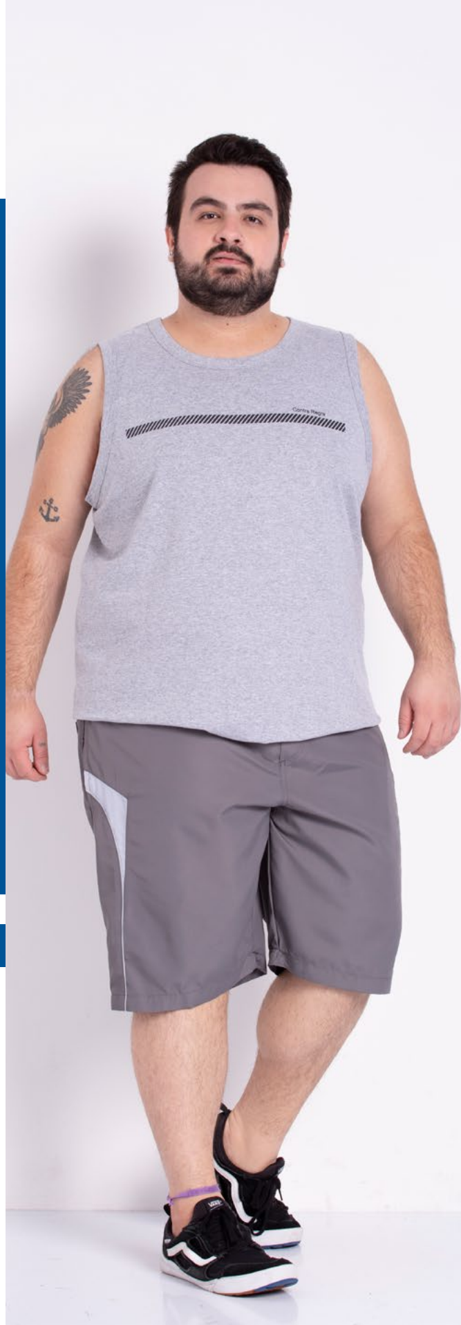
Regata Tradicional Malha 100% Algodão Tam.: P ao S8 Ref.: 4453