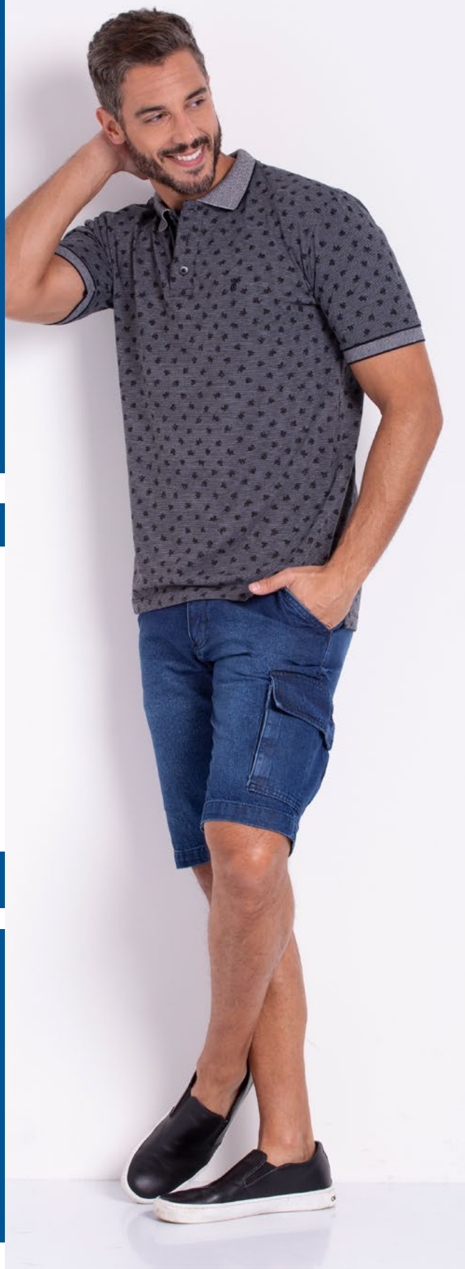
Camiseta Polo Street Listy 50% Algodão 50% Poliéster Tam.: P ao GG Ref.: 3093