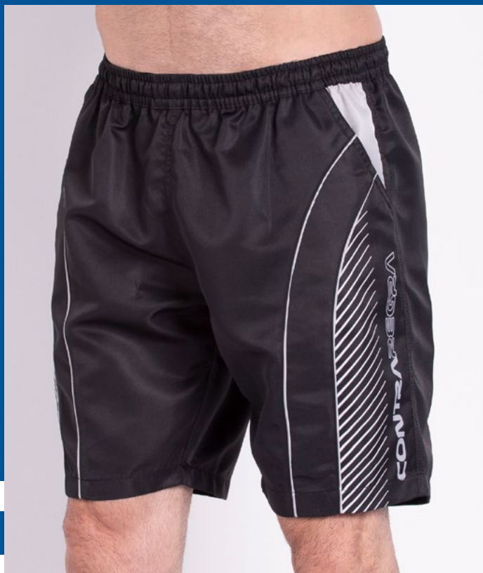
Bermuda Mais Curta de Elástico Micro Sarja 100% Poliéster Tam.: P ao S8 Ref.: 661