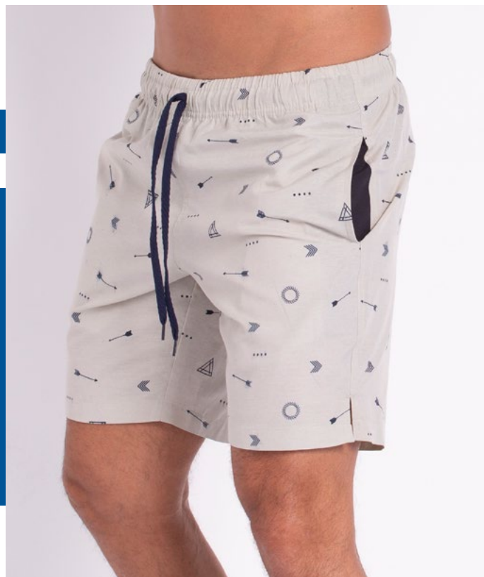
Shorts Mais Cumprido de Elástico Nyton 75% Algodão 25% Poliéster Tam.: 6 ao S5 Ref.: 399