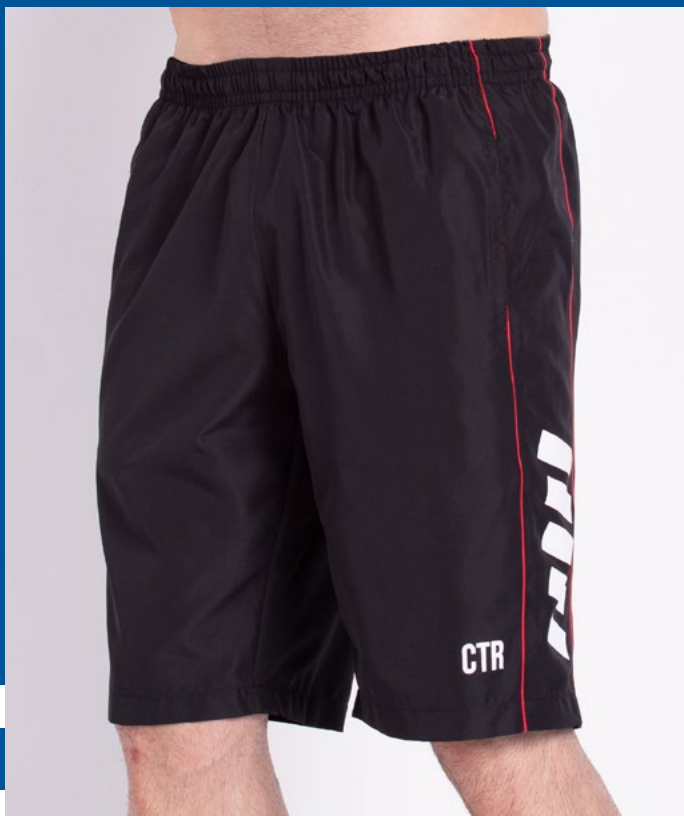
Bermuda de Elástico Exim Opac 100% Poliéster Tam.: P ao S8 Ref.: 410