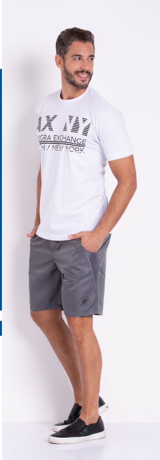
Camiseta Tradicional Malha 100% Algodão Tam.: P ao S5 Ref.: 1399