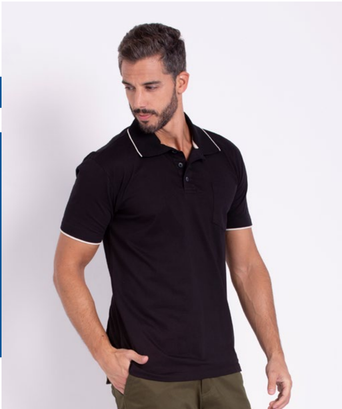
Camiseta Polo Tradicional Malha 100% Algodão Tam.: P ao S8 Ref.: 3341