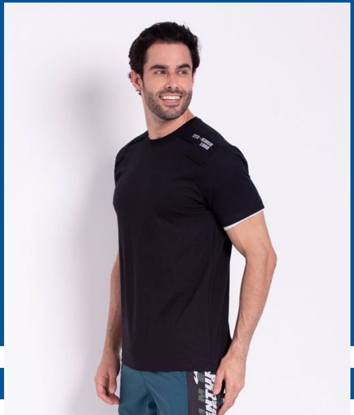
Camiseta Tradicional Malha 100% Algodão Tam.: P ao S8 Ref.: 1387