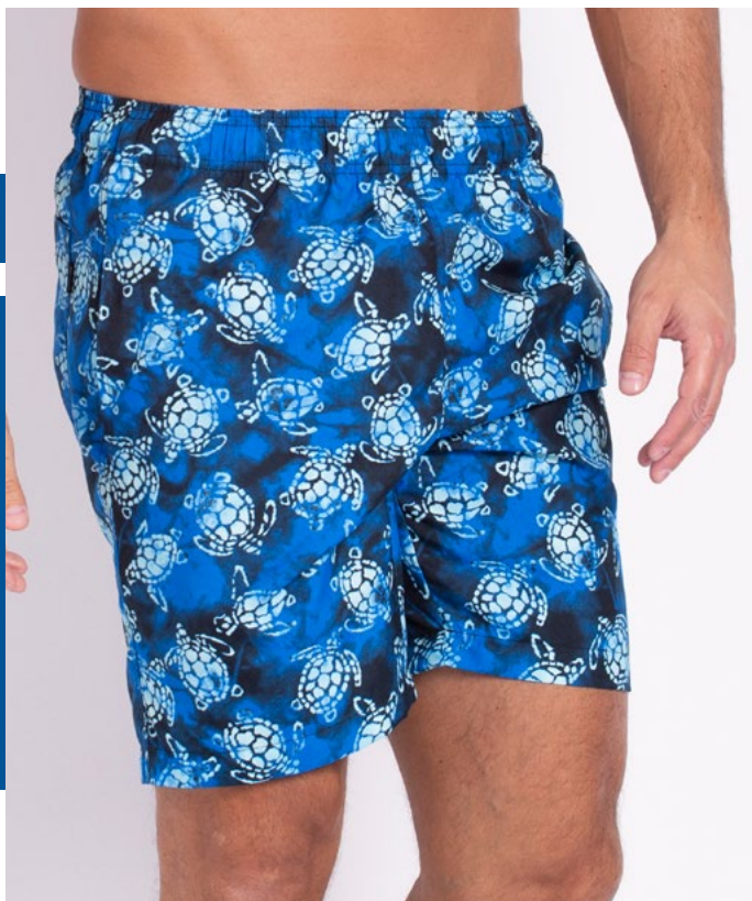
Shorts Mais Cumprido de Elástico Micro Fibra Estampada 100% Poliéster Tam.: 4 ao S3 Ref.: 418