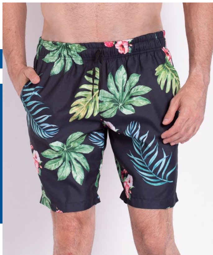
Shorts Mais Cumprido de Elástico Micro Sarja Neo Subli 100% Poliéster Tam.: P ao 55 Ref.: 401