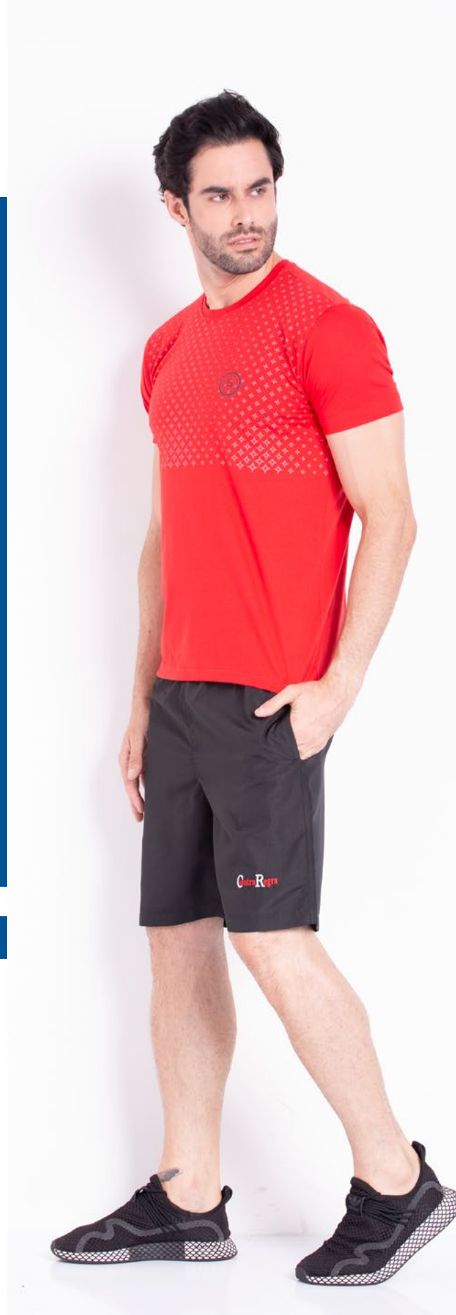
Camiseta Street Malha 100% Algodão Tam.: P ao GG Ref.: 1378