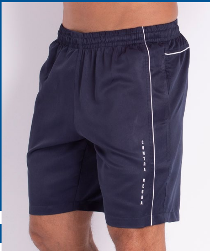
Bermuda Mais Curta de Elástico Micro Sarja 100% Poliéster Tam.: 4 ao S8 Ref.: 424