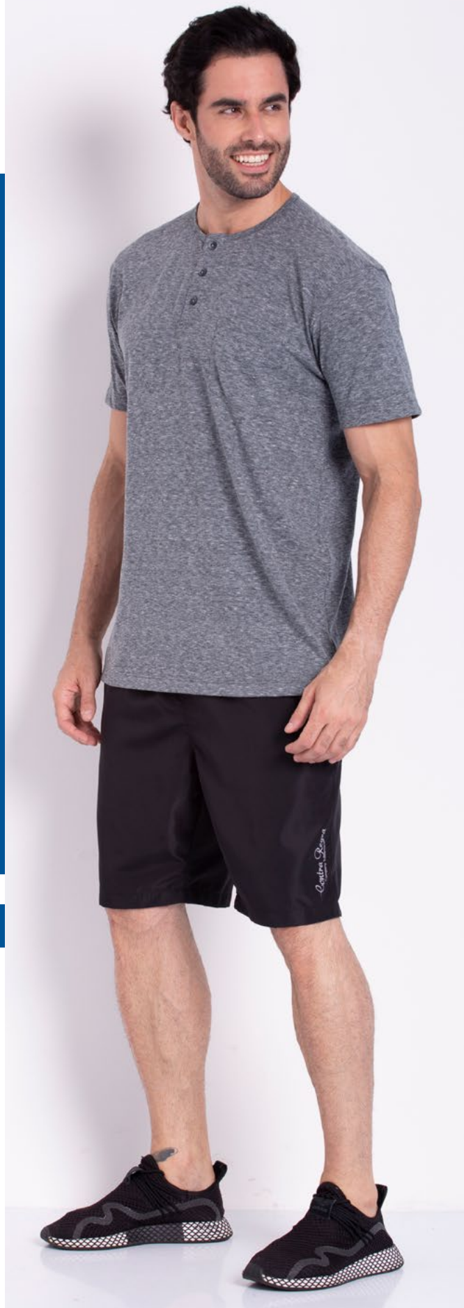
Camiseta Tradicional Henley Malha Stonel Ligth 40% Algodão 60% Poliéster Tam.: P ao S8 Ref.: 1272