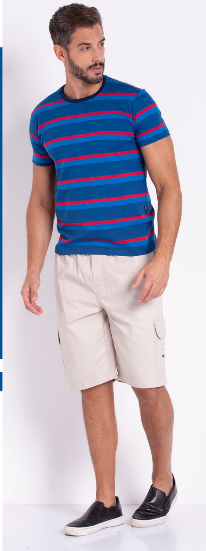
Camiseta Street Malha Filippo 100% Algodão Tam.: P ao GG Ref.: 1346