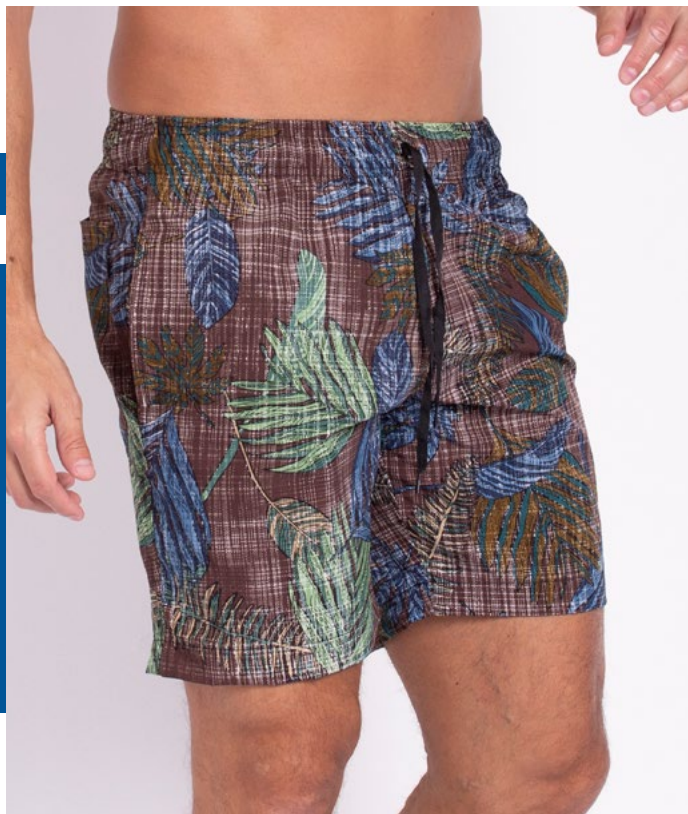
Shorts de Elástico Hidronautic 91% Poliéster 9% Elastano Tam.: P ao S5 Ref.: 325