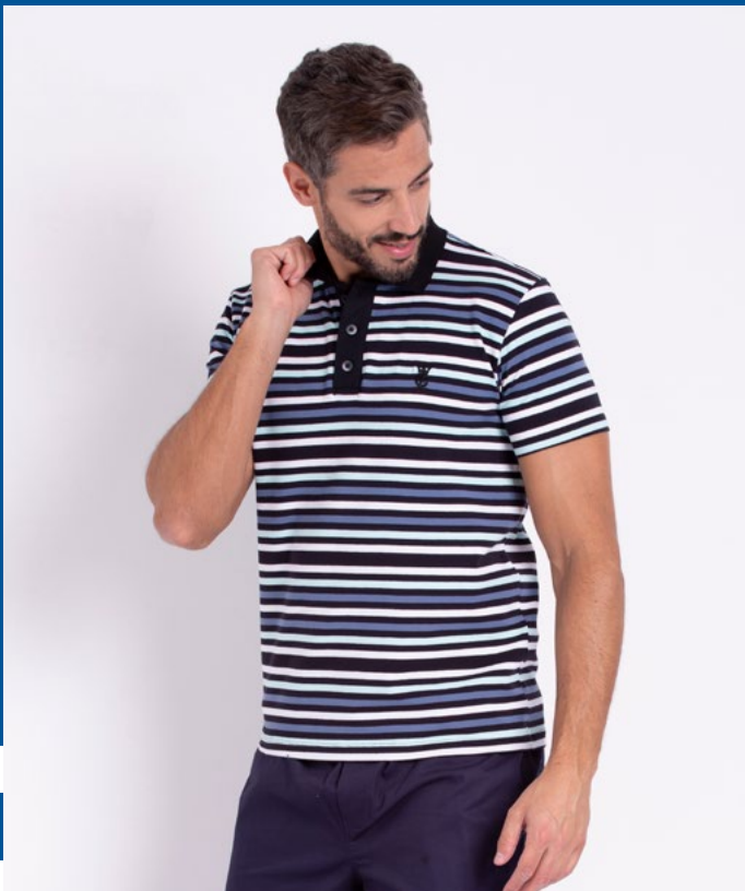
Camiseta Polo Street Cotton Ligth Listrado 97% Algodão 3% Elastano Tam.: P ao GG Ref.: 3365