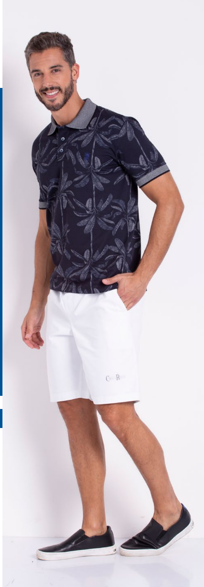
Camiseta Polo Street Jacquard 53% Algodão 47% Poliéster Tam.: P ao GG Ref.: 3356