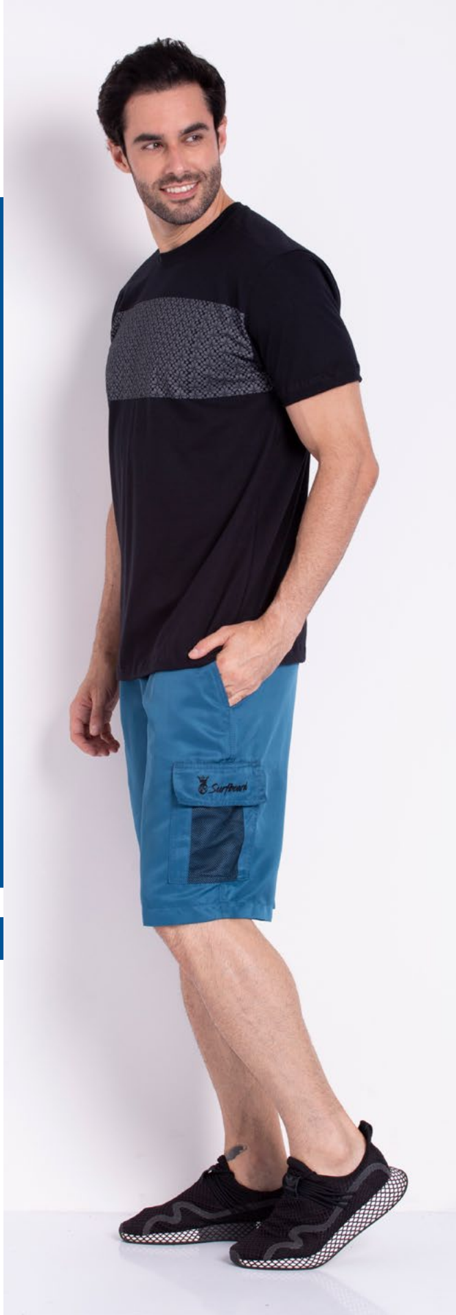
Camiseta Tradicional Malha 100% Algodão Tam.: P ao S8 Ref.: 1536