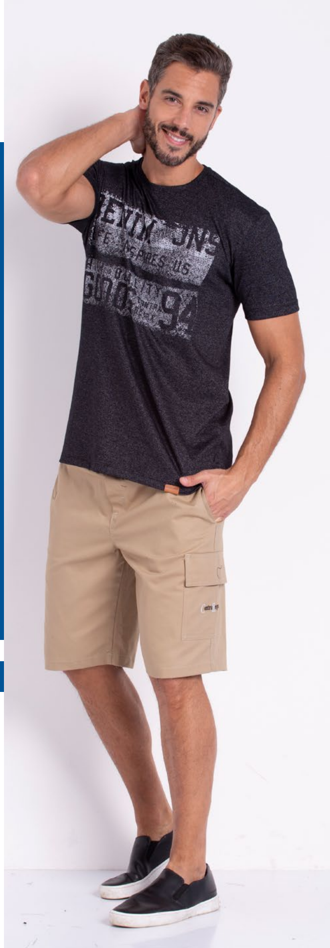
Camiseta Tradicional Sensation 62% Algodão 38% Poliester Tam.: P ao S8 Ref.: 1537