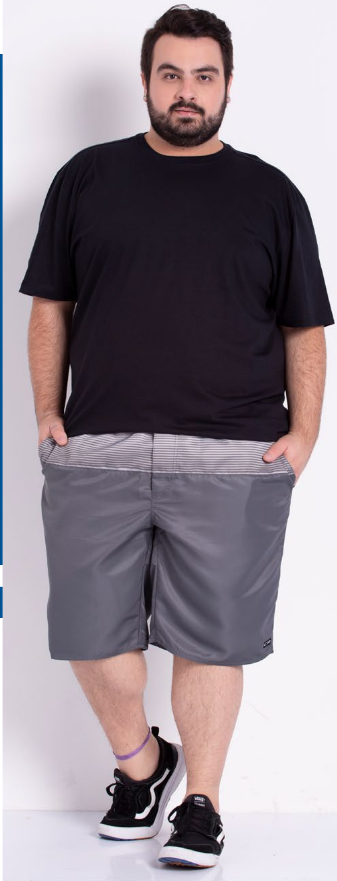
Camiseta Tradicional Malha 100% Algodão Tam.: 4 ao S8 Ref.: 1220