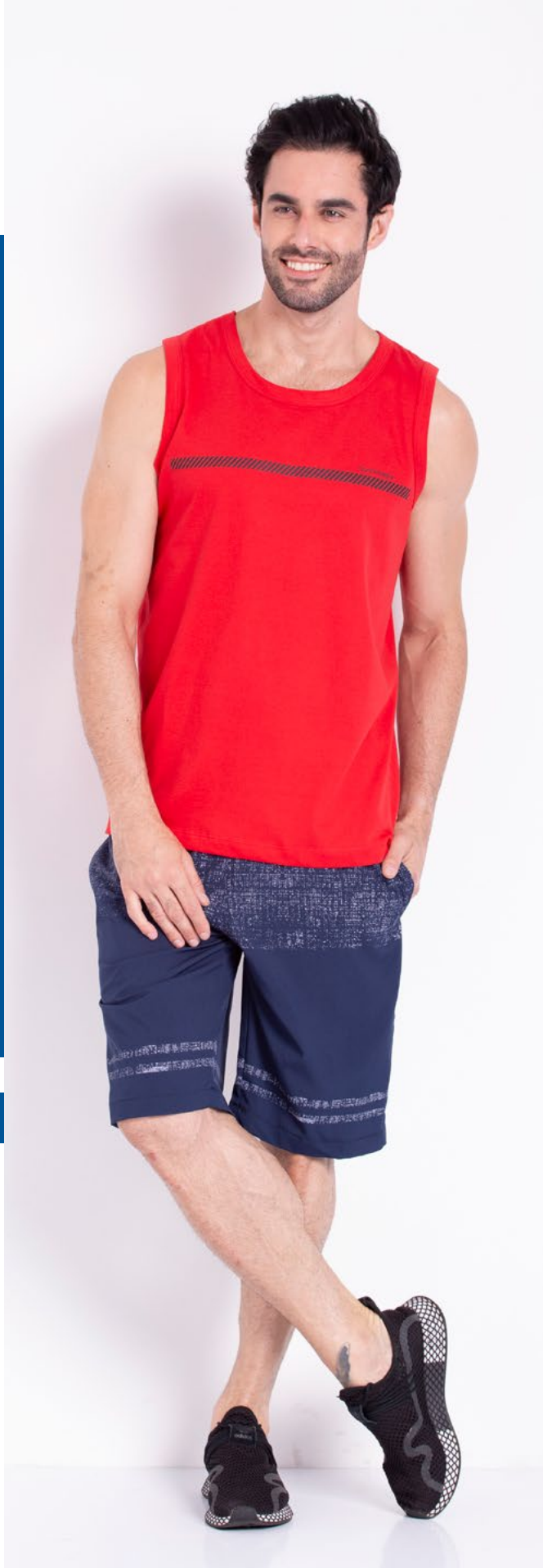
Regata Tradicional Malha 100% Algodão Tam.: P ao S8 Ref.: 4453