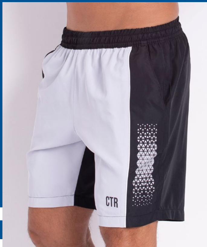
Bermuda Mais Curta de Elástico Exim Opac 100% Poliéster Tam.: P ao S5 Ref.: 423