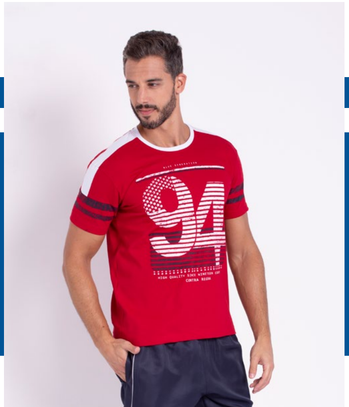
Camiseta Street Malha 100% Algodão Tam.: P ao GG Ref.: 1532