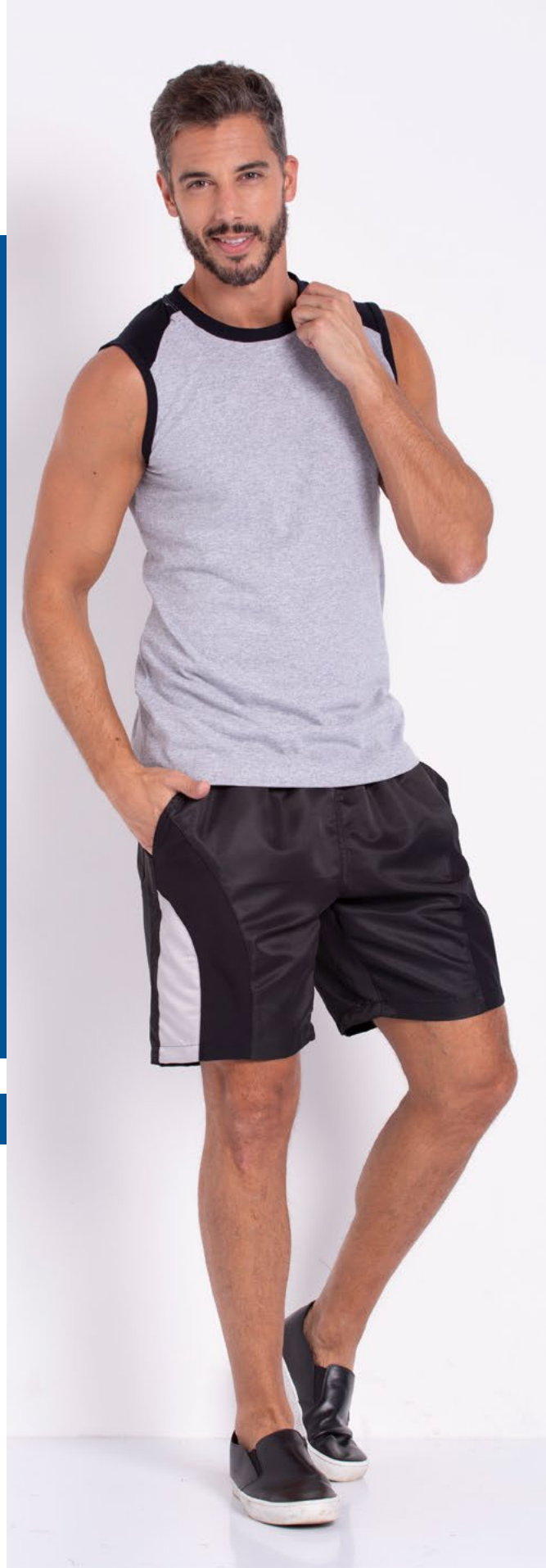
Regata Tradicional Malha 100% Algodão Tam.: P a ao S5 Ref.: 4454