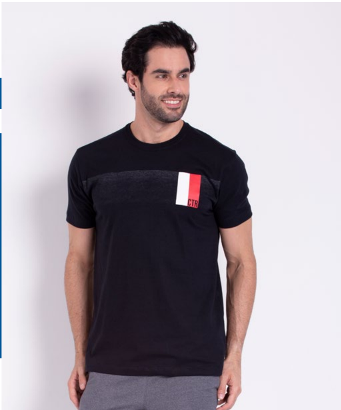
Camiseta Tradicional Malha 100% Algodão Tam.: P ao S8 Ref.: 1542