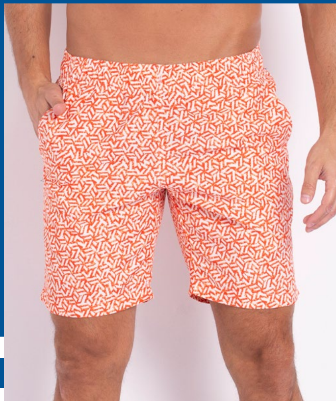
Shorts Mais Cumprido Micro Fibra Estampado 100% Poliéster Tam.: 10 ao 55 Ref.: 400