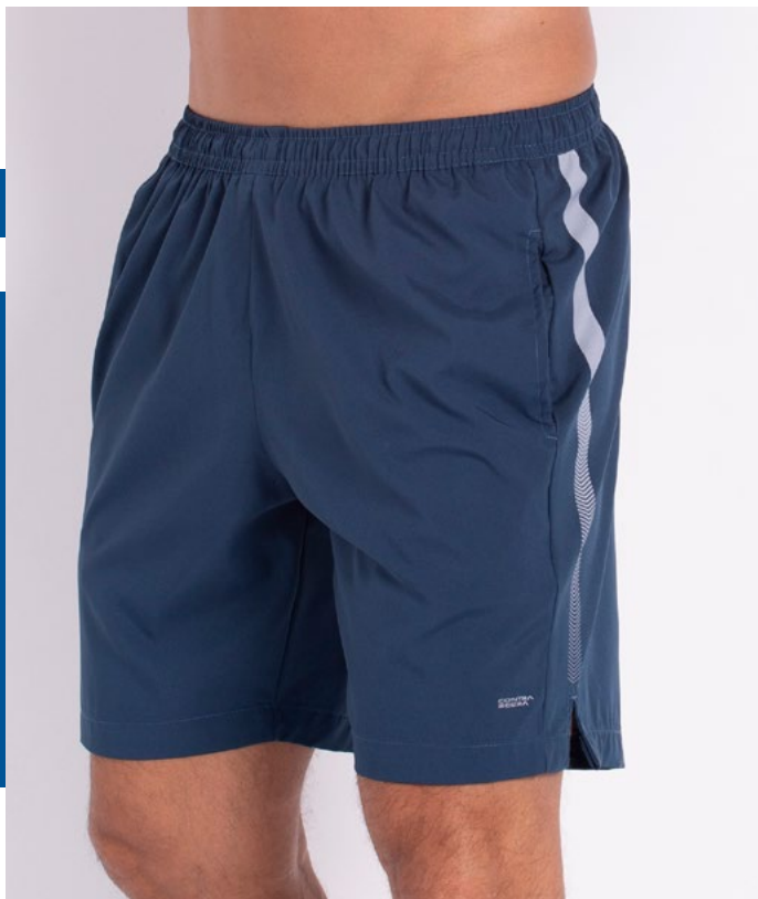
Bermuda Mais Curta de Elástico Hidronautic 91% Poliéster 9% Elastano Tam.: P ao S4 Ref.: 175