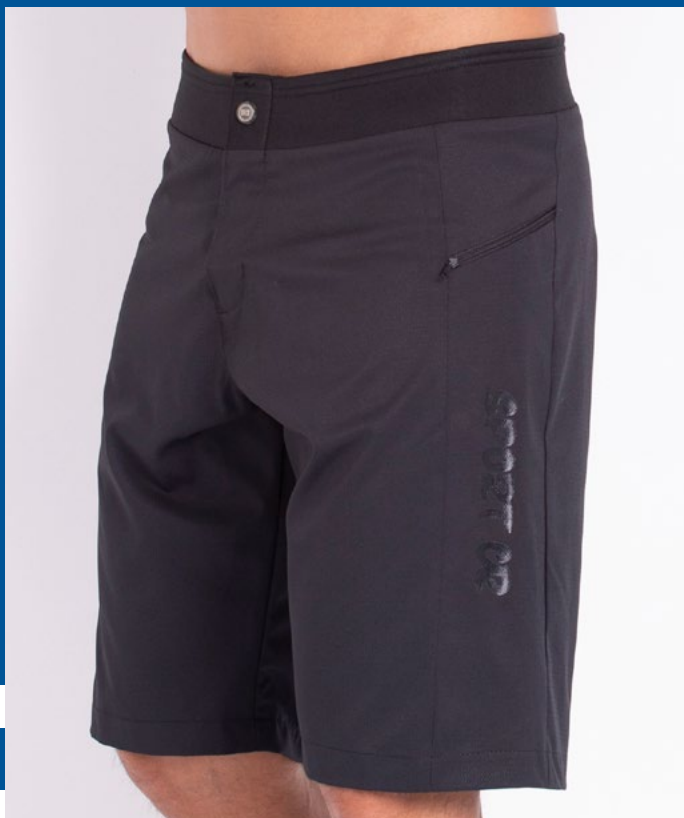
Bermuda Cós Neo Prene Dinamic Flex 90% Poliéster 10% Elastano Tam.: 36 ao 48 Ref.: 381