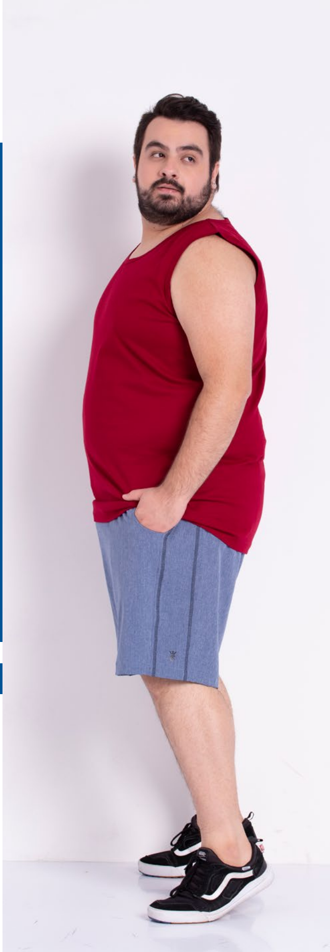
Bermuda Mais Curta Hidronatic 91% Poliéster 9% Elastano Tam.: P ao S8 Ref.: 207