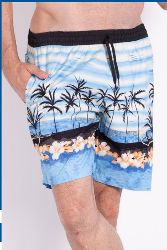
Bermuda Mais Curta de Elástico Micro Fibra Estampada 100% Poliéster Tam.: P ao S2 Ref.: 415