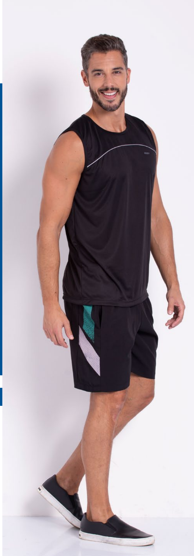
Regata Tradicional Fitness Helanca 100% Poliéster Tam.: P ao S5 Ref.: 4451