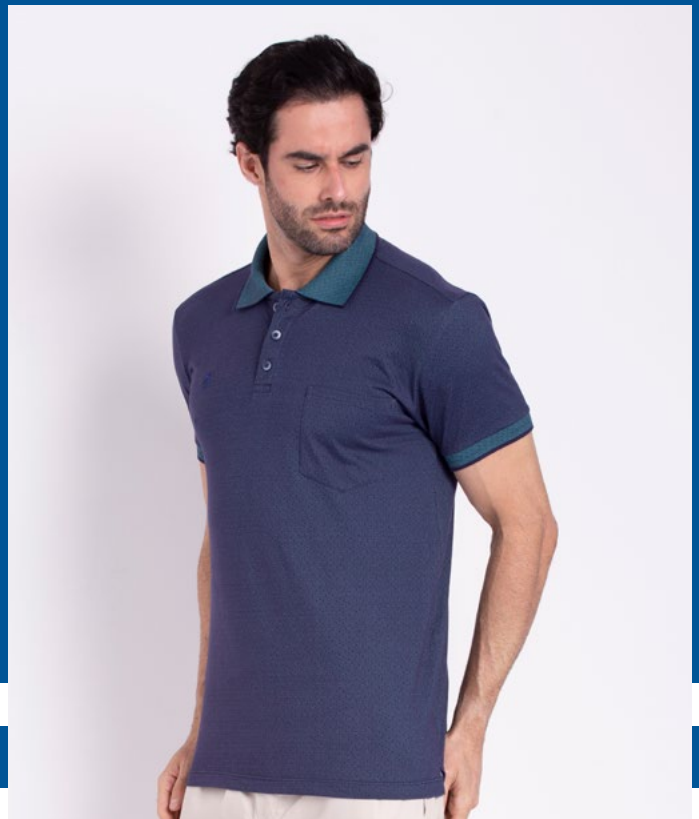
Camiseta Polo Tradicional Jacquard 95% Algodão 5% Elastano Tam.: P ao S5 Ref.: 3360