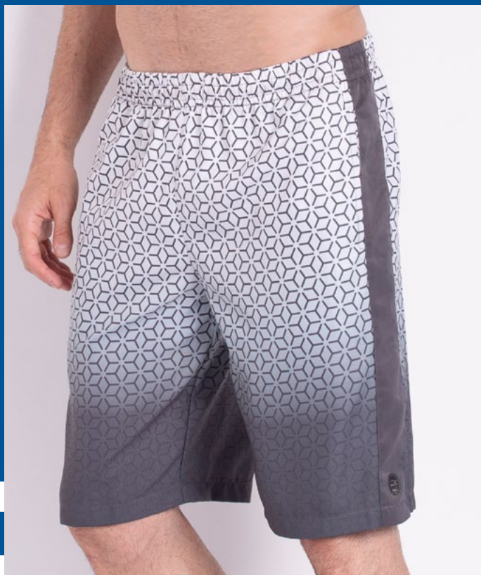
Bermuda de Elástico Micro Sarja Neo Subli 100% Poliéster Tam.: P ao S5 Ref.: 321