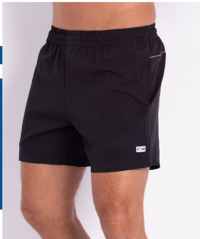
Shorts de Elástico Hidronautic 91% Poliéster 9% Elastano Tam.: P ao S5 Ref.: 419