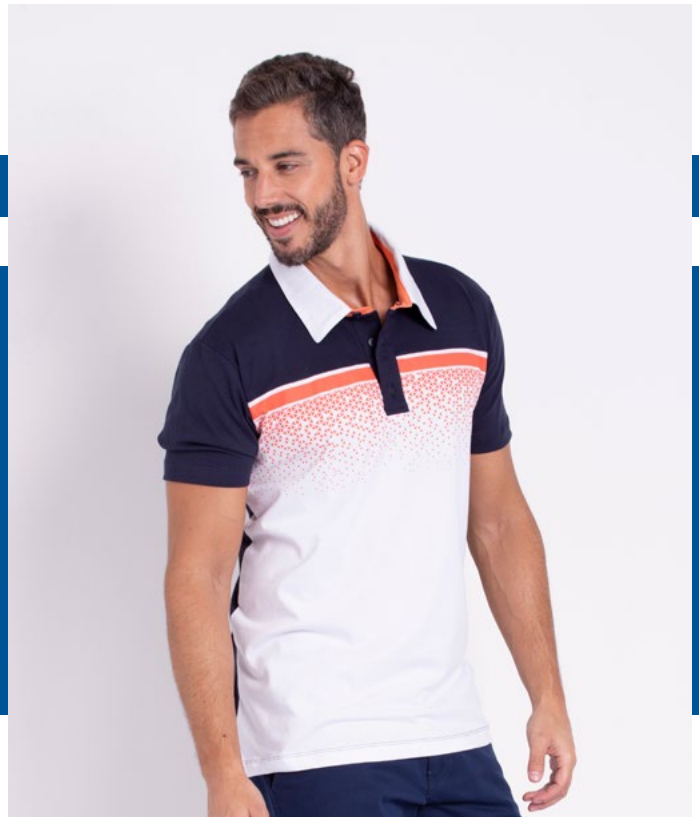
Camiseta Polo Tradicional Malha 100% Algodão Tam.: P ao S5 Ref.: 3370