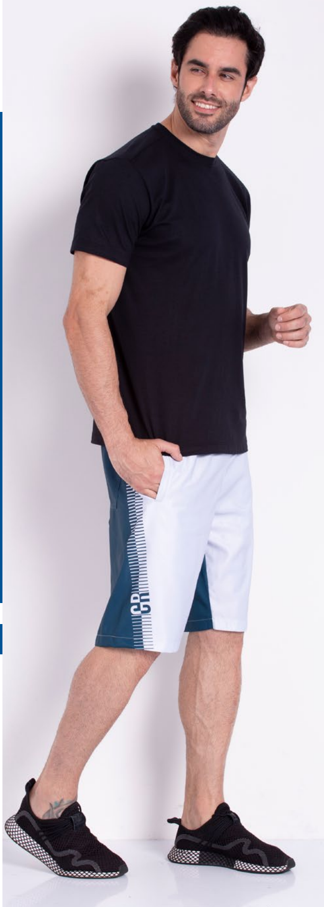
Camiseta Tradicional Malha 100% Algodão Tam.: 4 ao S8 Ref.: 1220