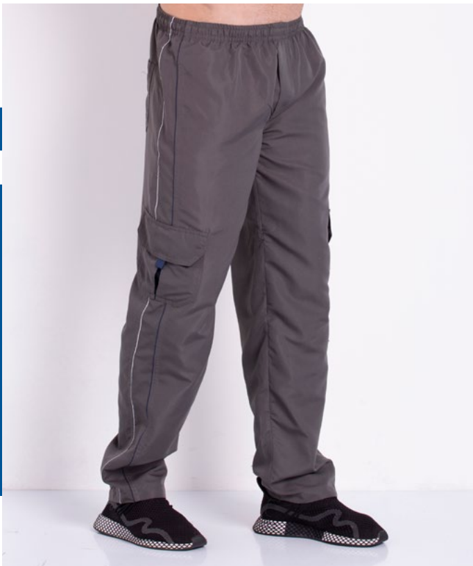
Calça de Elástico Micro Fibra 100% Poliéster Tam.: 2 ao S5 Ref.: 156