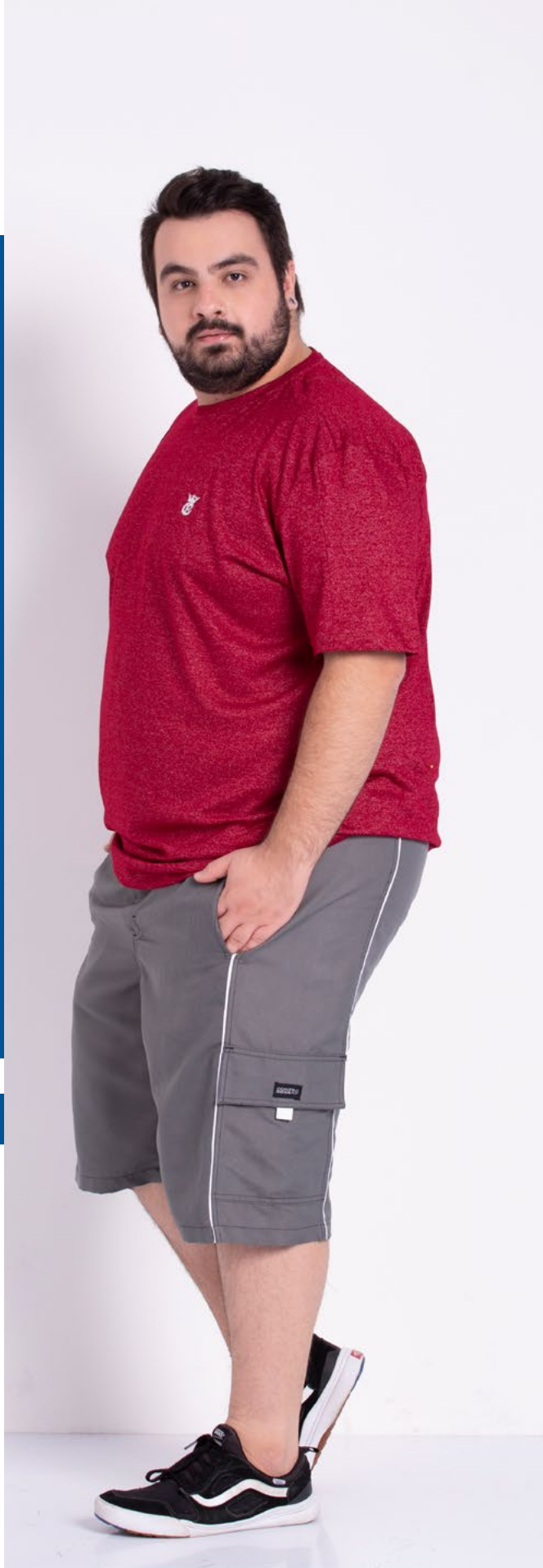
Bermudão Micro Fibrã 100% Poliéster Tam.: 4 ao S8 Ref.: 498