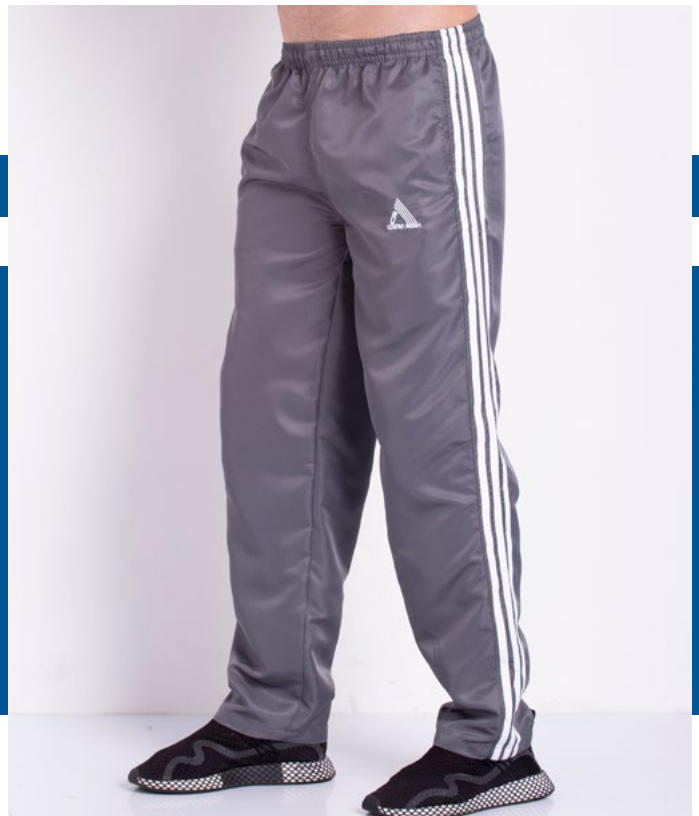
Calça de Elástico Micro Sarja 100% Poliéster Tam.: P ao S5 Ref.: 221