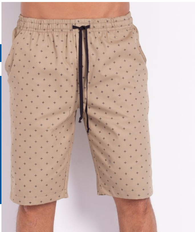
Bermuda Elástico Parati 100% Algodão Tam.: P ao S5 Ref.: 434