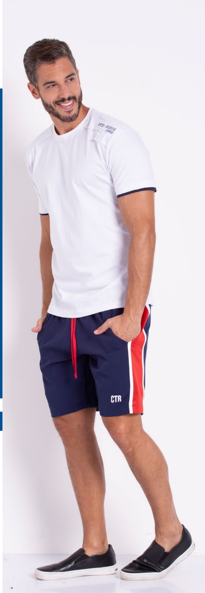
Camiseta Tradicional Malha 100% Algodão Tam.: P ao S8 Ref.: 1387