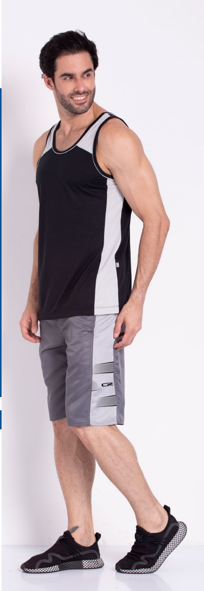
Regata Street 65% Poliéster 35% Viscose Tam.: P ao S8 Ref.: 4413