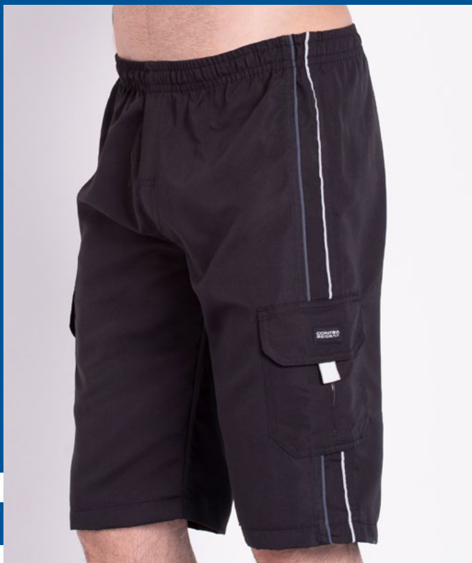
Bermudão de Elástico Micro Fibr 100% Poliéster Tam.: 2 ao S5 Ref.: 33