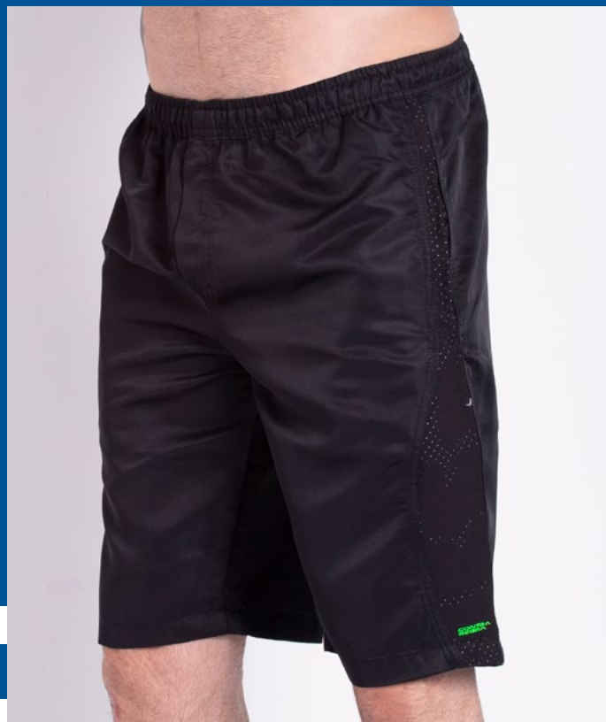
Bermuda de Elástico Micro Sarja 100% Poliéster Tam.: P ao S8 Ref.: 720