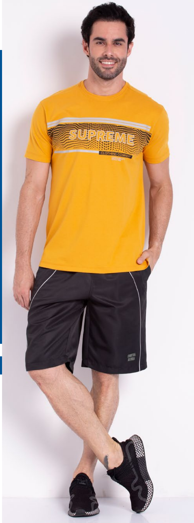
Camiseta Tradicional Malha 100% Algodão Tam.: P ao S5 Ref.: 1388