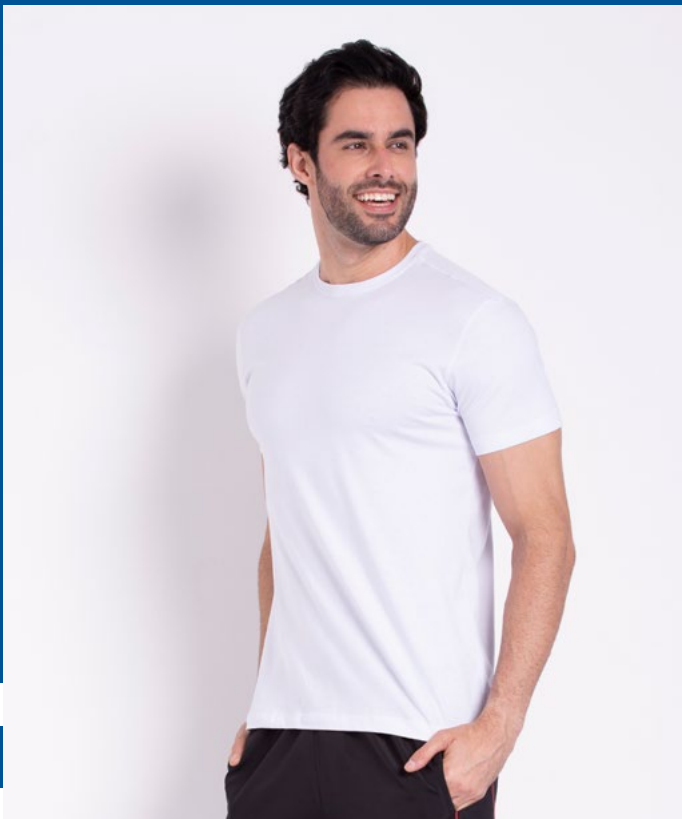
Camiseta Tradicional Malha 100% Algodão Tam.: 4 ao S8 Ref.: 1220