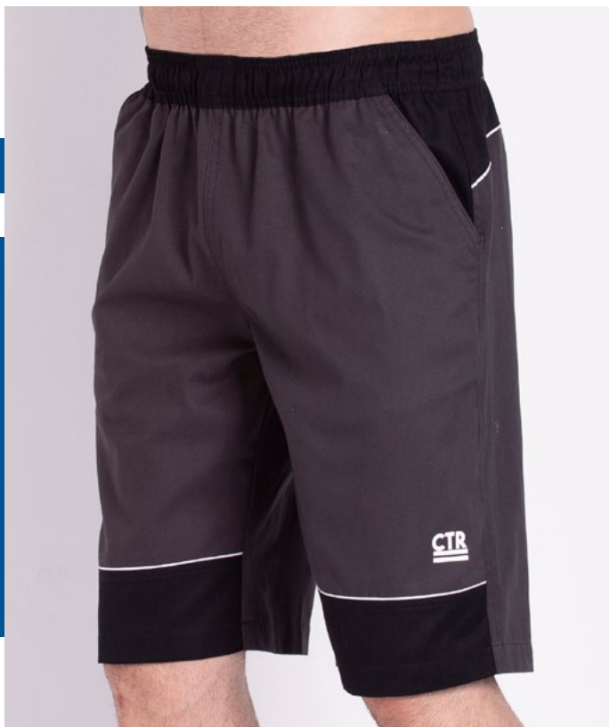
Bermuda de Elástico Ipanema 100% Algodão Ta.: P ao S5 Ref.: 432