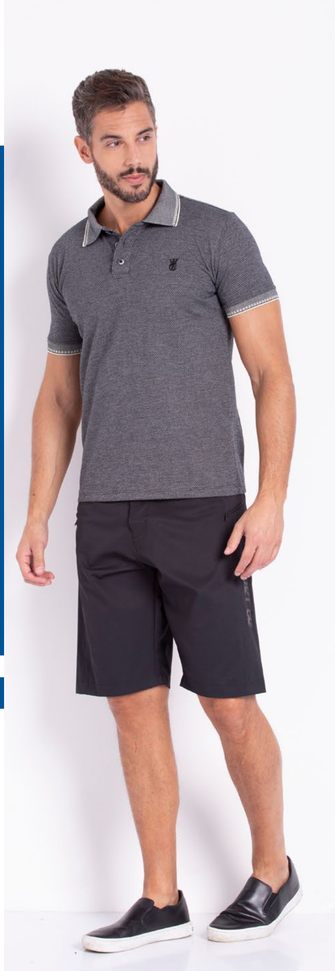
Camiseta Polo Street Malha Jacquard 60% Algodão 40% Poliéster Tam.: P ao GG Ref.: 3338