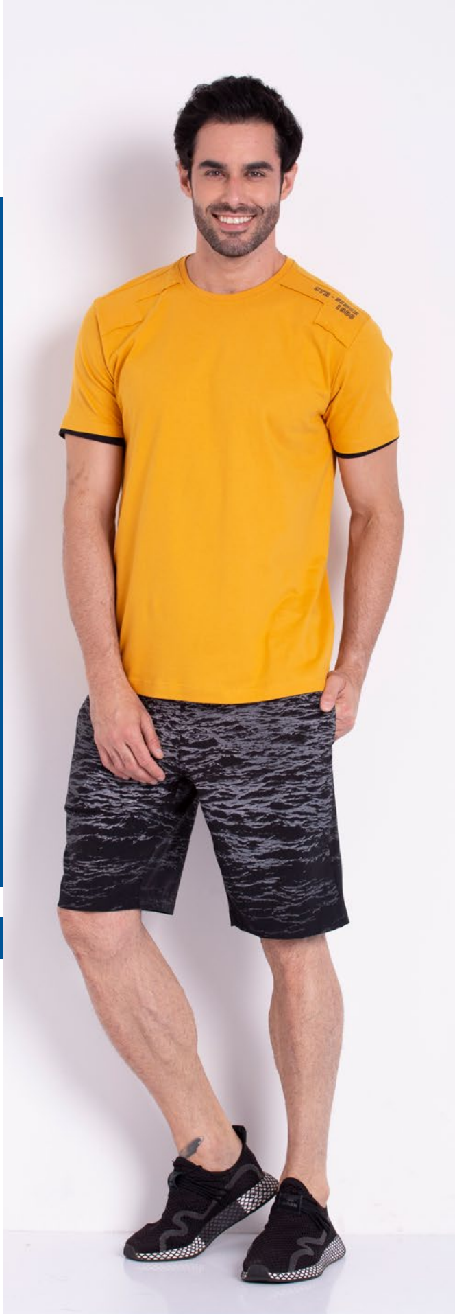
Camiseta Tradicional Malha 100% Algodão Tam.: P ao S8 Ref.: 1387