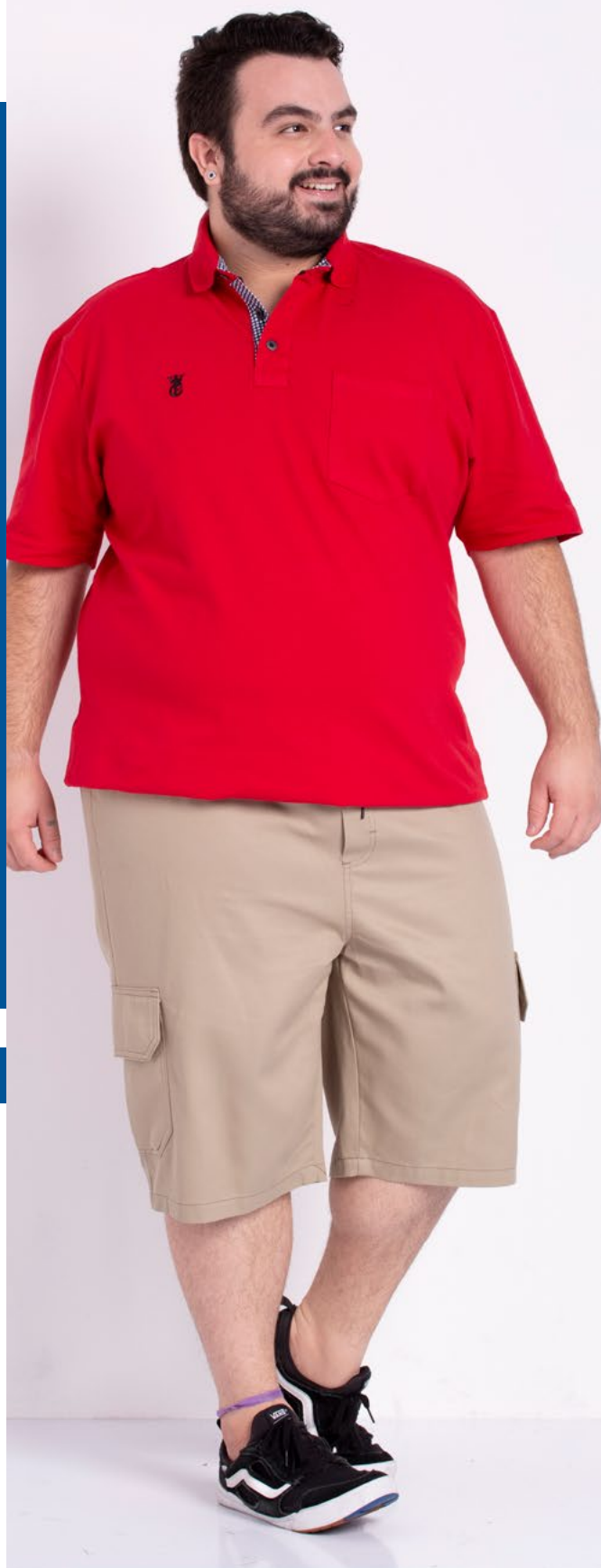
Camiseta Polo Tradicional Piquet 98% Algodão 2% Elastano Tam.: P ao S8 Ref.: 3445